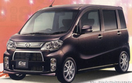
カラー：クリムゾンブロッコリスメタリック (メーカオプション26,250円税別)