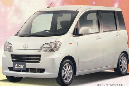
カラー：パールホワイトⅡ (メーカオプション26,250円税別)